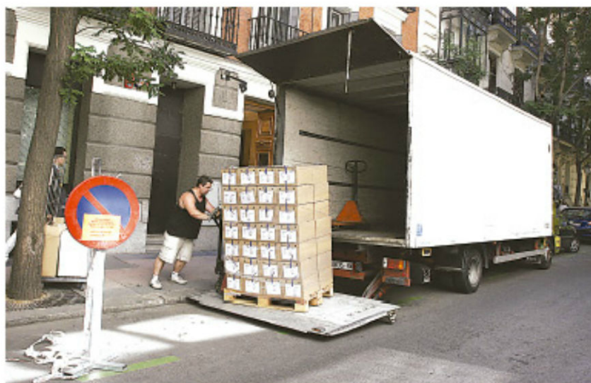
Varios miles de lotes de sellos de Afinsa no asignados a contratos se han remitido a la casa de subastas Heinrich Köhler.

En el caso de la colección de arte de Afinsa, la Administración Concursal informa sobre sus contactos con expertos en subastas de obras de arte como Ansorena,